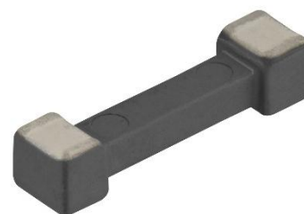
Image 4 : Exemple de produit 2: noyau en ferrite pour une bobine SMD