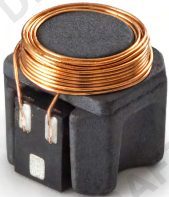
Bild 1. Miniaturisierter Transponder mit Ferritkern, Antennenwicklung und HF-RFID-IC.

RFID-gestützte Werkzeug- und Werkstück- Managementsysteme verhindern eine Fehlauswahl und ermöglichen einen fehlerfreien Werkzeugeinsatz.